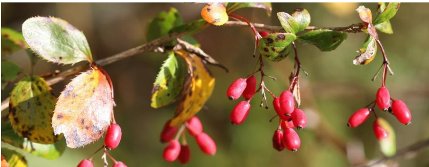
R. Dupré, MNHN-CBNBP

Au travers de témoignages d'aménageurs et de structures accompagnatrices, de visites de terrain, mais également de présentations d'outils pratiques, les participants pourront mieux appréhender les enjeux de la filière et ainsi mieux y contribuer.