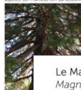
Elle photo vers 1784 par les belles-sœurs de la Comtesse Du Barry, favorite de Roi Louis XV.

Le séquoia géant présente deux particularités rares chez les végétaux : son bois n'a pas de résine mais on en trouve dans les feuilles, les bourgeons, et, les cônes et son tronc, royaume de