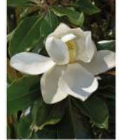
Elle photo vers 1784 par les belles-sœurs de la Comtesse Du Barry, favorite de Roi Louis XV. Copie de sa sœur venue d'Autan.

Il fut planté vers 1784 par les belles-sœurs de la Comtesse Du Barry, favorite du Roi Louis XV. L'origine des plants n'est pas connue avec certitude, sont-ils venus de Nantes ou de la Louisiane ? ou directement des Etats-Unis ?