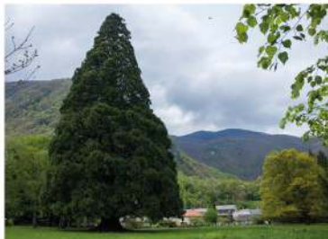
Elle photo vers 1784 par les belles-sœurs de la Comtesse Du Barry, favorite de Roi Louis XV.

La propriétaire actuelle, connaît et compte avec beaucoup de plaisir son histoire. Il est le neveu d'« Hercule », séquoia de dimensions exceptionnelles : 130 m de hauteur et 35 m de circonférence. Hercule vit dans une forêt, à 3 lieux de Murphy en Californie. La graine, ou plutôt le plant, aurait été rapporté par lui de son voyage vers les années 1850. Ce séquoia fait partie des premiers séquoias arrivés en France puisque la date d'introduction du séquoia est estimée à 1853.