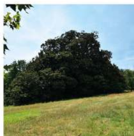
Elle photo vers 1784 par les belles-sœurs de la Comtesse Du Barry, favorite de Roi Louis XV.

La biodiversité est au maximum dans cette forêt miniature gardant ses feuilles tout l'hiver. De plus, il est au milieu d'une prairie entourée d'arbustes variés. Ce type de paix doit faire rêver plus d'un de ses localitaires. Bon nombre d'insectes pollinisateurs sont attirés par ses grandes fleurs blanches, dont les carpelles extrêmement solides résistent aux coléoptères très froids de leur nectar. Une particularité de ses fleurs est que les pétales et les sépales ne sont pas différenciés, c'est une fleur à moitié très solide. Il existe plus d'une centaine d'espèces de cette famille, dont on a retrouvé des fossiles, datant de quatre-vingt quinze millions d'années.